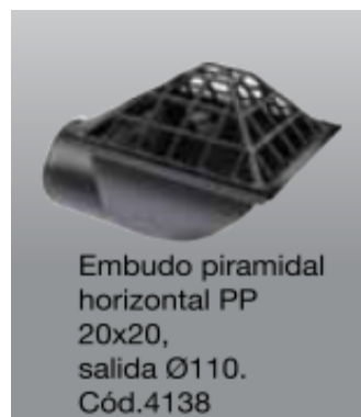
Embudo piramidal horizontal PP 20x20, salida Ø110. Cód.4138

Se deberá colocar en cada embudo de acero inoxidable un globo de alambre según el diámetro de